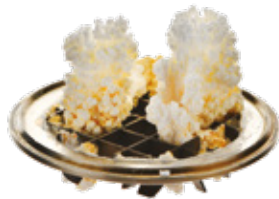
Ohne ClearNOx ®